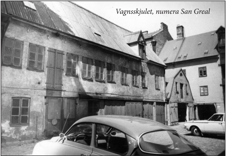
Vagnsskjulet, numera San Greal

Jodå, på 1960-talet var det mer motorolja än champagne som spilldes här. På nedervåningen i huset på bilden håller champagnebaren till idag och det enda som egentligen är kvar är korsviket och de bärande träbjälkarna.