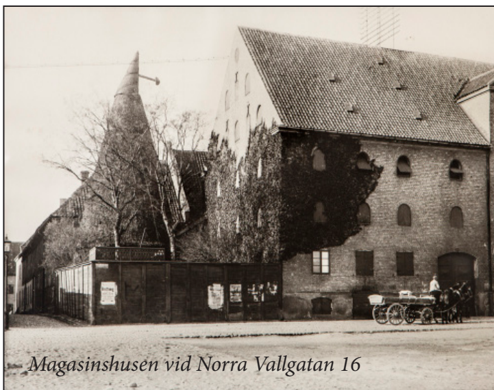
Magasinshusen vid Norra Vallgatan 16

En annan av kvarterets största byggnader, nu kallad Kryddloftet, har stått på en helt annat plats i Malmö tidigare. Hela denna stora korsvirkesbyggnad flyttades hit på 1980-talet, stock som sten, för att bevara en viktig del av Malmös historia.